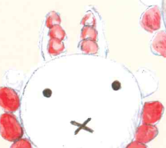
ミッフィーちゃん ¥3,900(+税)