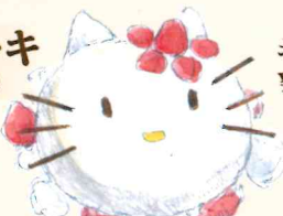
キティーちゃん ¥3,800(+税)